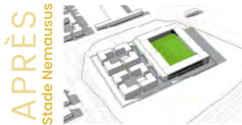
APRÈS Stade Nemausus